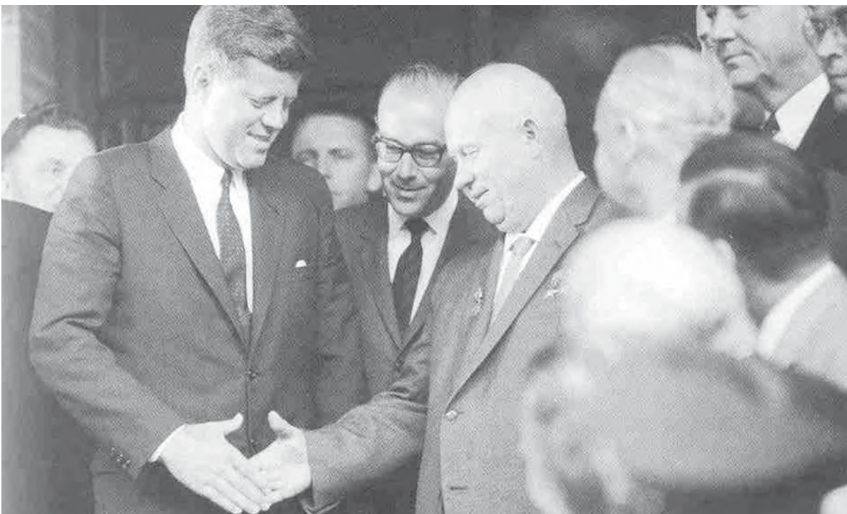
La “convergencia”, significó sucumbir ante el capitalismo y el imperialismo e ingresar en la disputa de las zonas de influencia.

Raymond Aron expresa formalmente estos puntos de vista en su trabajo: “ die Entwicklung der Industriegesellschaft und der sozialen Stratification ” (1957), a pesar de que le sucedió a su anterior libro “ L’Opium des intellectuels ” (La opinión de los intelectuales) (Paris 1955), en el que declara: “En occidente, la controversia entre capitalismo y socialismo pierde su real intensidad” y sus “Sorbonne lectures” (1955–1956), posteriormente incluidas en su obra “ Dixhuit lecons sur la societe industrielle ” (Paris 1962) en la que por primera vez trató de