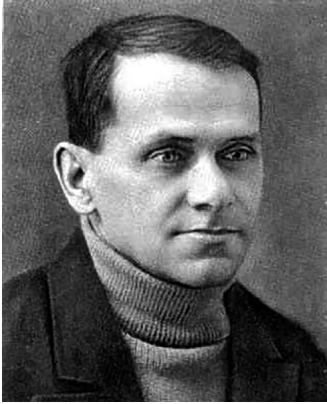
Pavel Blonsky (1884-1941). Ucraniano, participante de la lucha revolucionaria, fue el más destacado pedagogo y sicólogo de esta corriente. Se señala una amplia producción de más de 200 trabajo sobre psicología y educación. Fue el primer rector de la Academia de Formación Socialista (más tarde Academia N. Krúpskaya de Educación Comunista).

Para Blonsky, nuevamente se pone a la fábrica como el espacio educativo más idóneo para la formación polivalente, considerando que allí podrá ganar en disciplina, conciencia de sí mismo y un mayor nivel de libertad. Plantea estructurar el sistema a partir del jardín de la infancia, el “robinsoneo” en la colonia escolar, el internado de escuela de trabajo familiar y la escuela del trabajo para adolescentes ligada a la fábrica a través de una enseñanza interdisciplinar.